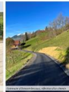
Commune d'Oron-la-Village, refector d'un hameau