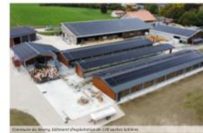
Commune de Bière, bâtiment d'exploitation de 220 vaches laitières