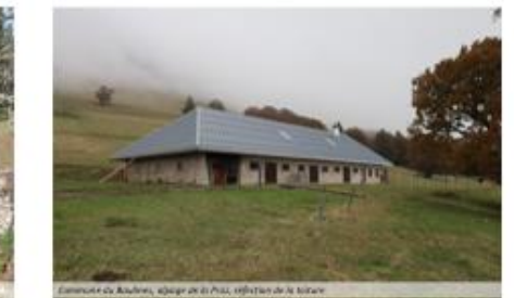
Commune de Ruffines, espace de la PMA, refector de la ferme