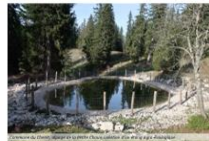
Commune de Chaux, espace de la pêche et du contact de la nature agricole