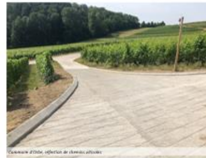
Commune d'Orbe, refector de l'école agricole