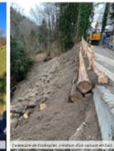
Commune de Courgenon, travaux d'entretien en bois