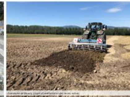
Commune de Bussy, plans d'amélioration des terres agricoles